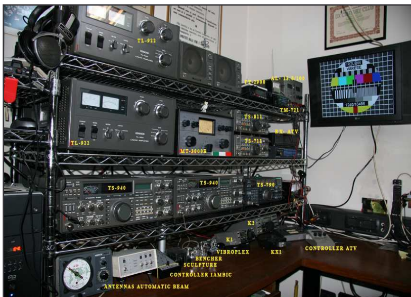
Oh boy! Stazione di alta qualità con addirittura le etichette! Questo super shack con tanto di monitor TV e numerosi diplomi alle pareti, posizionato su tavolo ad angolo di noce massello senza badare a spese è di IK2JYW Pier . E' stato il primo a inviare la foto.

“Digital mode (10/15/20/40m) – power 10 to 50 watt; CW mode only QRP Elecraft 10/15/20/40m) – power 0,1 to 10 watt;”