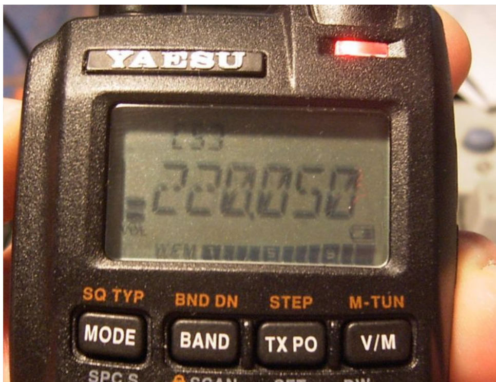
(Trasmissione attiva anche a 220,050 Mhz )

L'operazione e' fattibile da tutti e non presenta complicanze, evitate di toccare menù nascosti che non conoscete o non documentati, il rischio di trovarvi tra le mani un RTX inservibile o da buttare e' reale, il sottoscritto non si assume nessuna responsabilità per eventuali danni causati al tecnologico VX-3 da operazioni maldestre o fatte da personale non esperto.