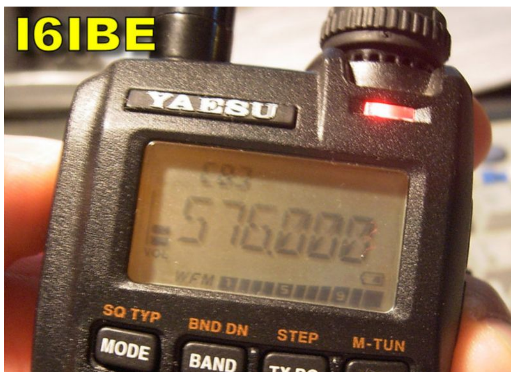
( ecco il VX-3E che trasmette allegramente a 576,00 MHz)

L'operazione e' fattibile da tutti e non presenta complicanze, evitate di toccare menù nascosti che non conoscete o non documentati, il rischio di trovarvi tra le mani un RTX inservibile o da buttare e' reale, il sottoscritto non si assume nessuna responsabilità per eventuali danni causati al tecnologico VX-3 da operazioni maldestre o fatte da personale non esperto.