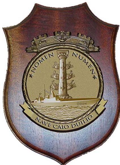
Il premio per il 1° classificato

Altri premi saranno riconosciuti a quanti si classificheranno dal secondo al quinto posto.