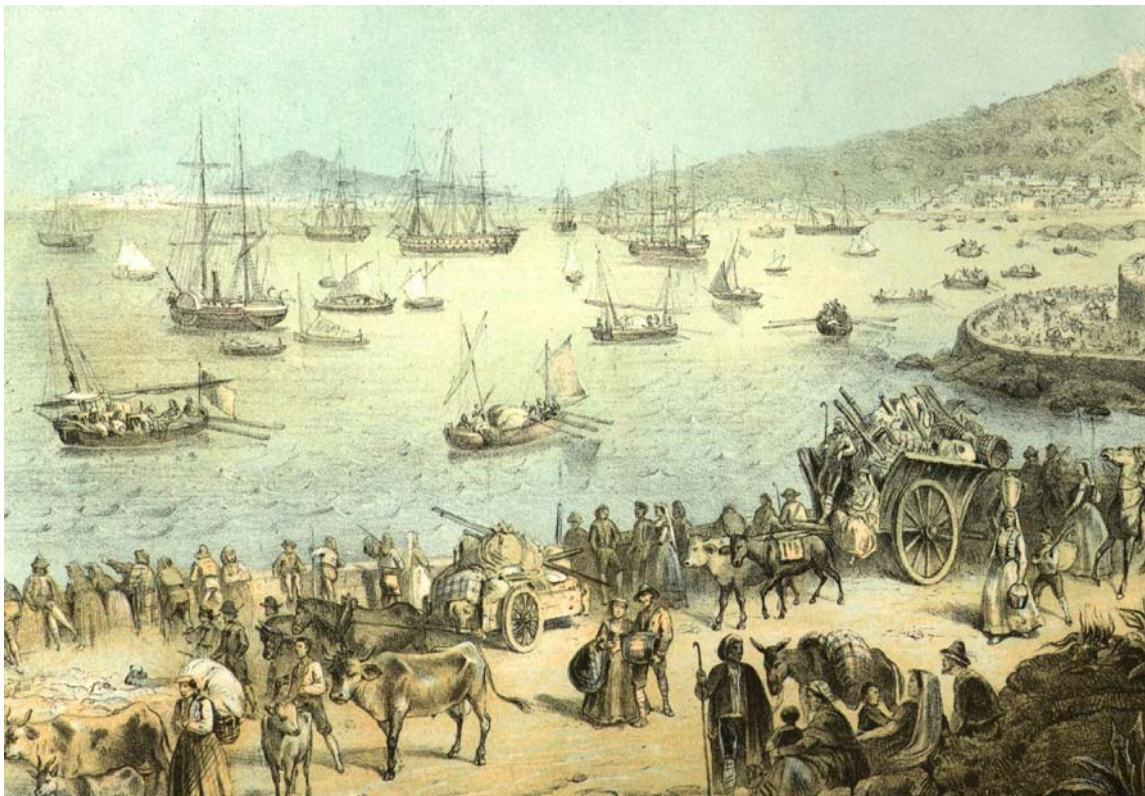
Litografia di Carlo Perrin – 1861 – Evacuazione del Borgo di Gaeta durante l'armistizio

Infatti, come certamente la storia ricorda, fu proprio in questi luoghi che, il 13 Febbraio 1861, si concludevano le vicende storiche del più grande Regno dell'Italia meridionale a favore di un'Italia unita.