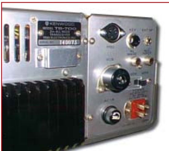
foto 4 Intervento, sul retro dell'apparato, per installare la presa DIN 5 poli

quenza risultante si avvicina a 41.800 kHz e la sua regolazione fino a frazioni di kHz permette di recuperare gli errori accumulati fino ad una precisione di 10 Hz... o giù di lì.