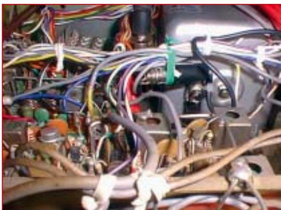
foto 2 Il segnale per eccitare il frequenzimetro è prelevato sull'uscita del VFO sul connettore RCA, tramite un condensatore ceramico da 820pF